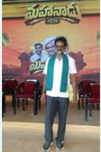
స్వర్ణ సాగరం బుచ్చినాయుడు కండ్రీగ