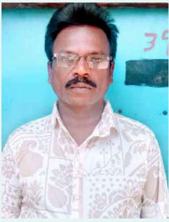
స్వర్ణ సాగరం శ్రీకాళహస్తి రూరల్