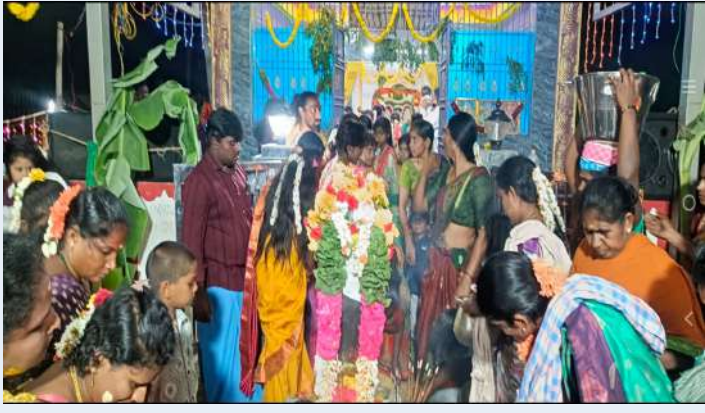
పెళ్లకూరు స్వర్ణసాగరం మే 26.

మండలంలోని పెళ్లకూరు, చెంబేడు గ్రామాల్లో స్థానికులు మంగళవారం గంగమ్మ జాతర వైభవంగా నిర్వహించారు. ఈ సందర్భంగా గంగమ్మ ఆలయాలను విద్యుత్ దీపాలతో అందంగా అలంకరించి, ఆలయ ప్రాంగణమంతా చదుపు పందిళ్లు వేశారు. గ్రామ దేవతలకు ఆయా గ్రామాల ప్రజలు కుంకుమార్చన పూజలు చేసి పొంగళ్ళు పెట్టారు. మంగళ వాయిద్యములు, మేక తాళాలు నడుమ కుమ్మ బూరలు ఊడుతూ గంగ పెట్టిన ఊరేగిస్తూ వీర జాతీలను వేశారు. నూతనంగా ఏర్పాటు చేసిన గంగమ్మ దేవాలయంను అంగరంగ వైభవంగా విద్యుత్ దీపాలతో, పూలమాలతో అందంగా అలంకరించారు. గ్రామస్థులు పెద్ద ఎత్తున పాల్గొని పొంగళ్ళు పెట్టి అమ్మవారికి నైవేద్యం సమర్పించారు. గంగమ్మ తల్లికి ప్రత్యేక అభిషేచాలు, విశేషమైన అర్చనలు చేసి అమ్మవారి కృపా కటాక్షములు అందుకున్నారు. ఈ కార్యక్రమంలో ఆయా గ్రామాల భక్తులు, ప్రజలు పాల్గొన్నారు.