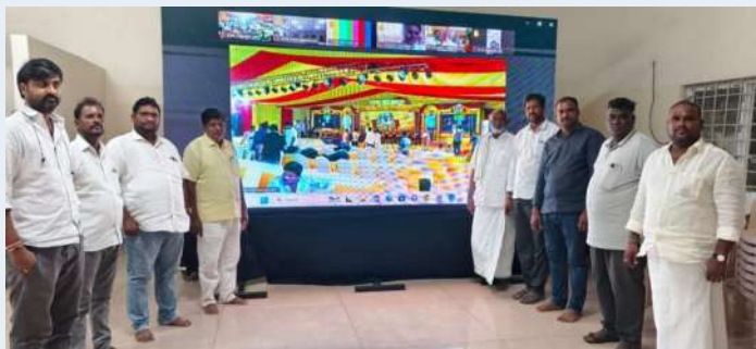
పెళ్లకూరు స్వర్ణసాగరం మే 26.