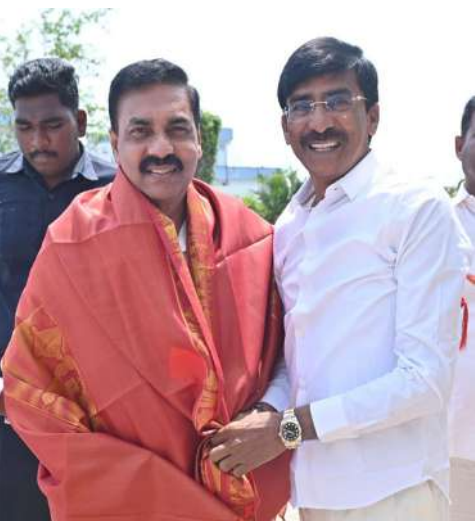
ఎస్ ఐ ఆర్ అవగాహన సదస్సులో మాజీ మంత్రి కాకాణి