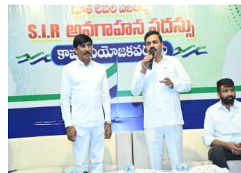
కావలి స్వర్ణ సాగరం మే 26