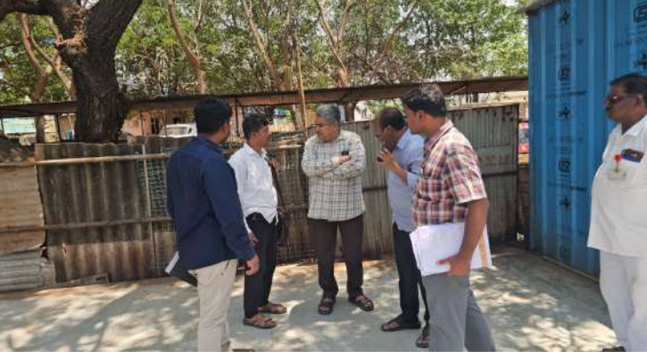
స్వర్ణ సాగరం (నాయుడుపేట) మే 26.