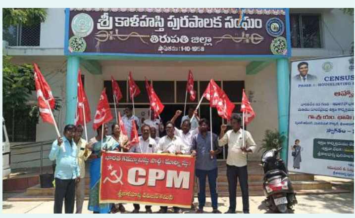
స్వర్ణ సాగరం శ్రీకాళహస్తి రూరల్