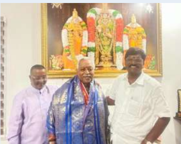
స్వర్ణ సాగరం (నాయుడుపేట) మే 26.