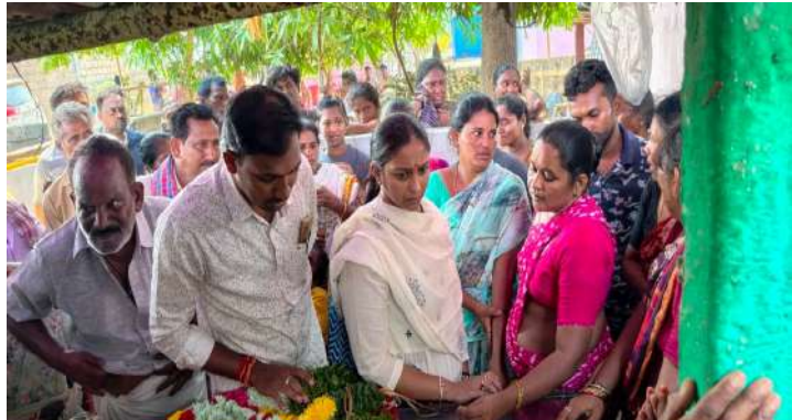
స్వర్ణసాగరం - తొట్లంబేడు,

సేవాభావంతో అందరి మన్ననలు పొందిన ఉపాధ్యాయురాలు రాజకీయ, ఐసీడీఎస్ వర్గాల ఘన నివాళి,